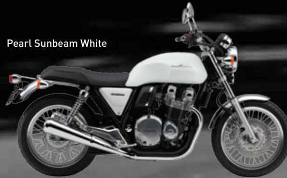
Pearl Sunbeam White