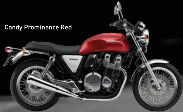
Candy Prominence Red