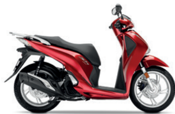
Pearl Splendor Red

Farben Mit diesen Farben bleiben Sie sicher nicht unentdeckt.