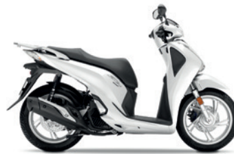
Pearl Cool White