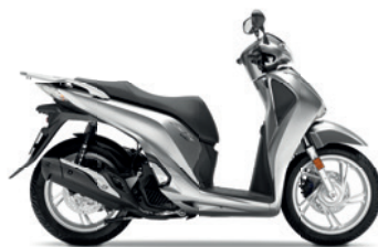
Lucent Silver Metallic