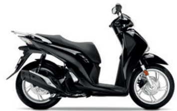
Pearl Nightstar Black