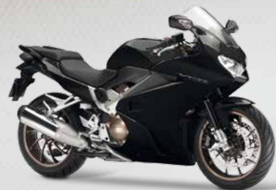
DARKNESS BLACK METALLIC