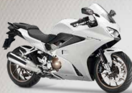
PEARL GLARE WHITE

Bei unserer Auswahl an drei stylischen Farben ist für jeden Geschmack etwas Passendes dabei.