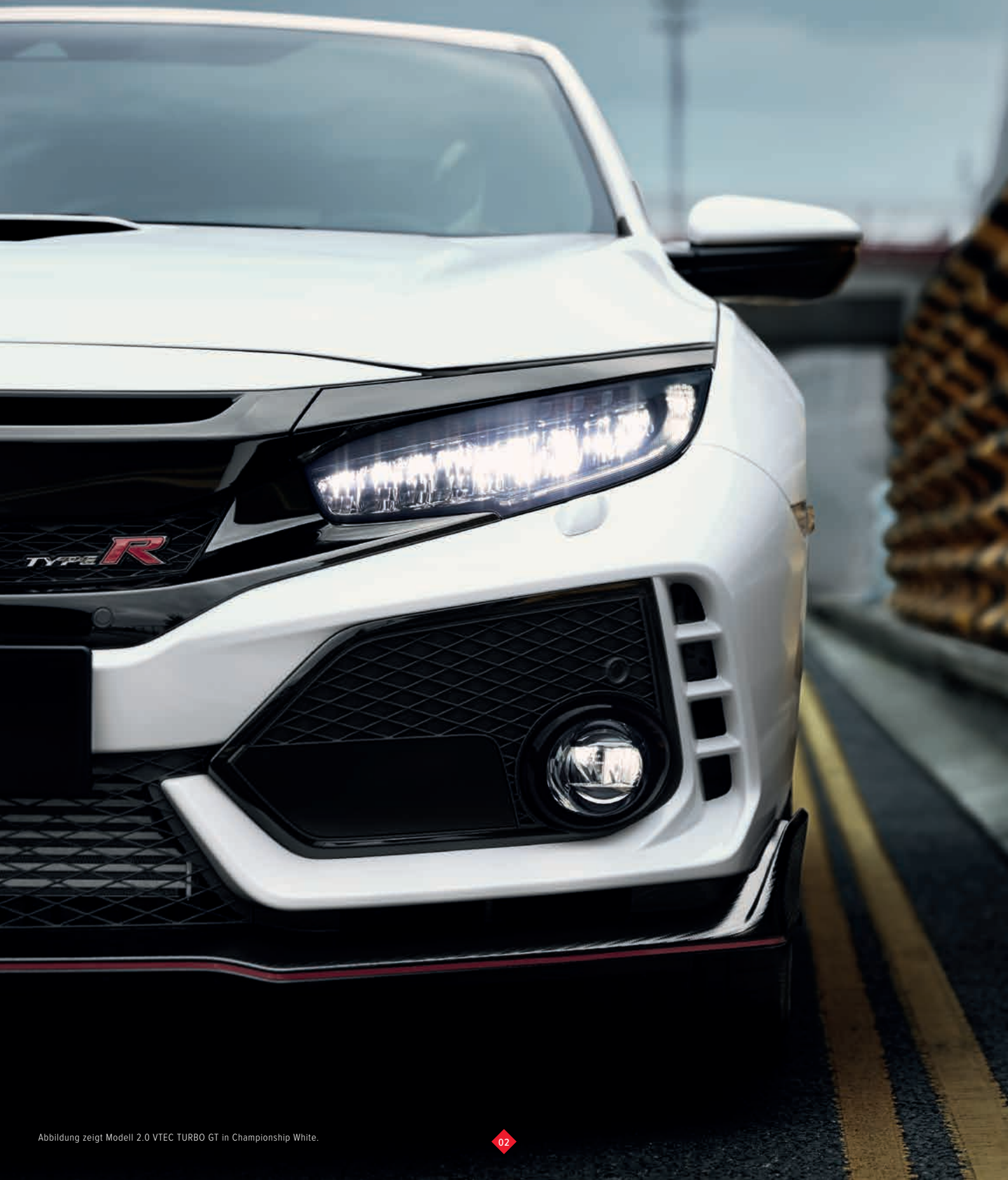
Abbildung zeigt Modell 2.0 VTEC TURBO GT in Championship White.