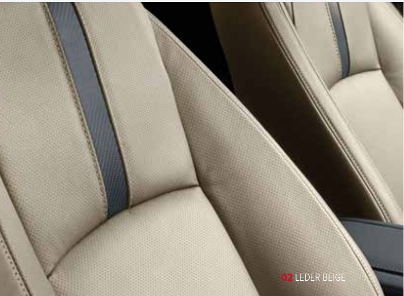
02 LEDER BEIGE