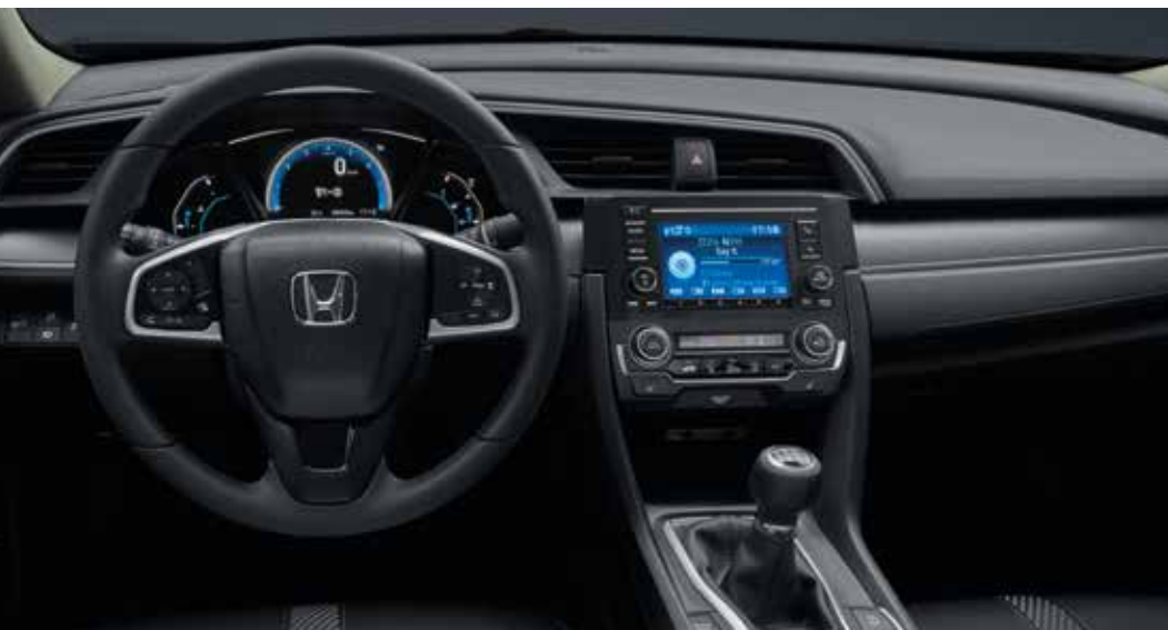
Abbildung zeigt Modell 1.5 VTEC TURBO Comfort in Taffeta White. Die vollständigen technischen Daten dieses Modells finden Sie ab Seite 42.

** Verwenden Sie stets nur empfohlene USB-Speichergeräte. Einige USB-Speichergeräte funktionieren möglicherweise mit diesem Audio-Gerät nicht.