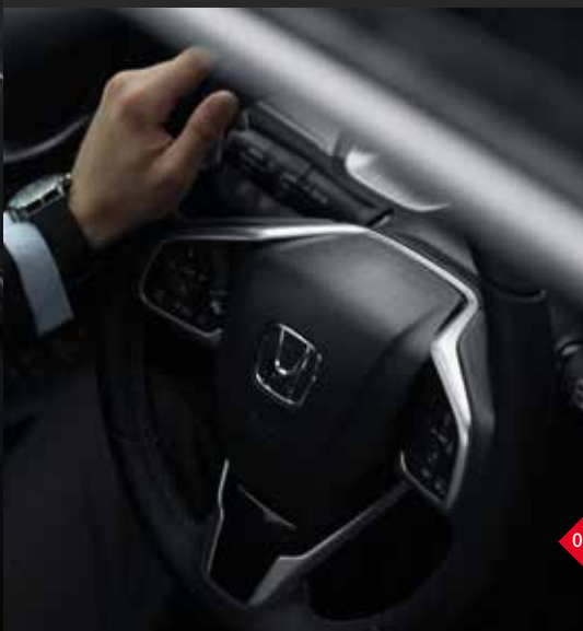
Abbildung zeigt Modell 1.5 VTEC TURBO Executive in Polished Metal Metallic.

Wir möchten, dass Sie jede Fahrt genießen. Daher haben wir eine Umgebung geschaffen, in der Sie sich mit Ihrem Fahrzeug verbunden fühlen. Die ergonomische und dennoch sportliche Fahrer-Sitzposition in Verbindung mit der neuen elektrischen Servolenkung gibt Ihnen ein Höchstmaß an Rückmeldung und Kontrolle.