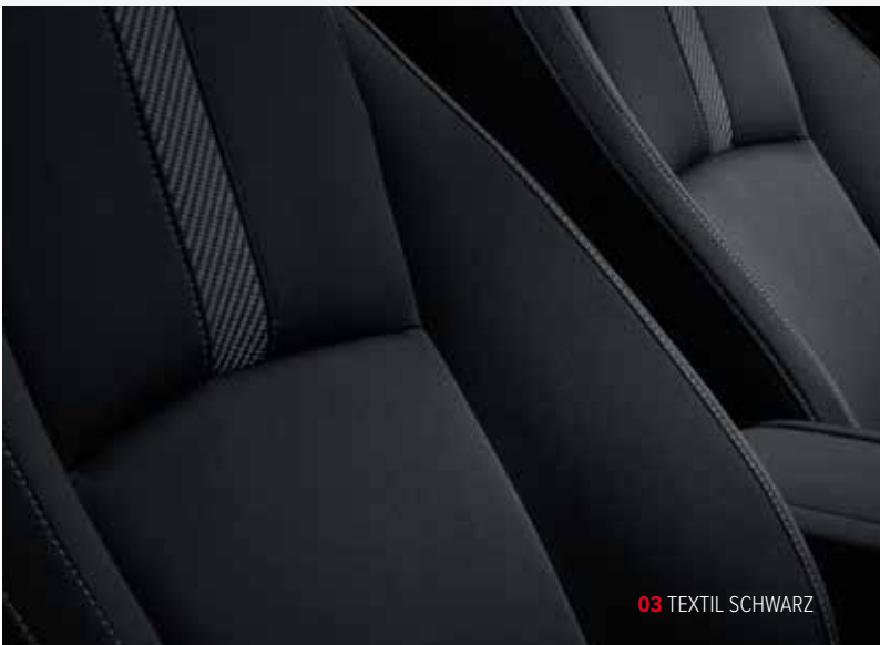
03 TEXTIL SCHWARZ