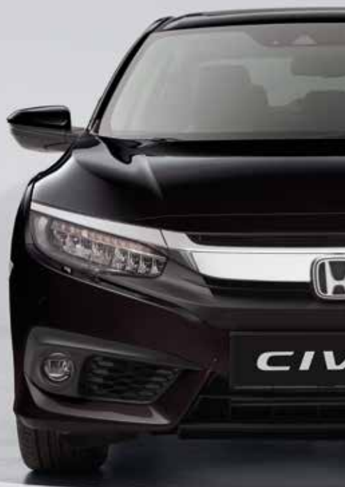
MIDNIGHT BURGUNDY PEARL