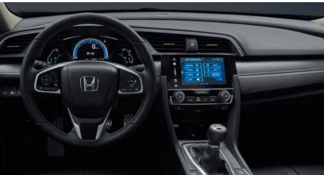
Abbildung zeigt Modell 1.5 VTEC TURBO Executive in Polished Metal Metallic. Die vollständigen technischen Daten dieses Modells finden Sie ab Seite 42.

*** Verwenden Sie stets nur empfohlene USB-Speichergeräte. Einige USB-Speichergeräte funktionieren möglicherweise mit diesem Audio-Gerät nicht. Nur iPhone 5 oder neuere Geräte mit iOS 8.4 oder neuem Betriebssystem sind mit Apple CarPlay™ kompatibel. Für die Nutzung von Android Auto™ müssen Sie die Android Auto™-App von Google Play™ auf Ihr Smartphone herunterladen. Nur Android 5.0 (Lollipop) oder neuere Versionen sind mit Android Auto™ kompatibel.