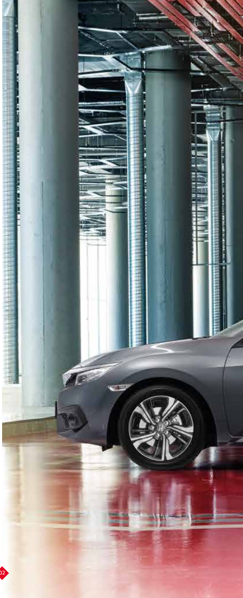
Abbildung zeigt Modell 1.5 VTEC TURBO Executive in Polished Metal Metallic.