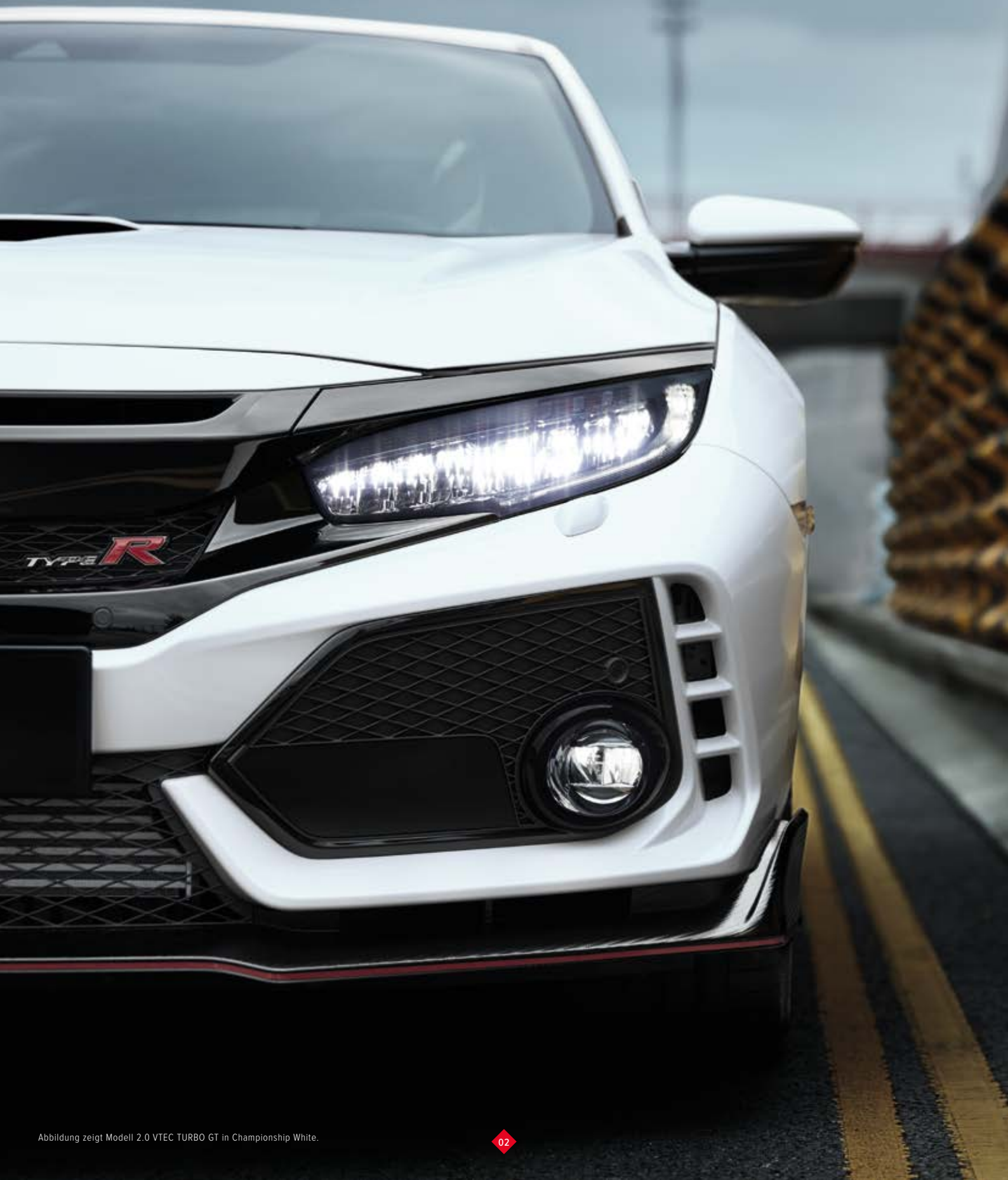
Abbildung zeigt Modell 2.0 VTEC TURBO GT in Championship White.