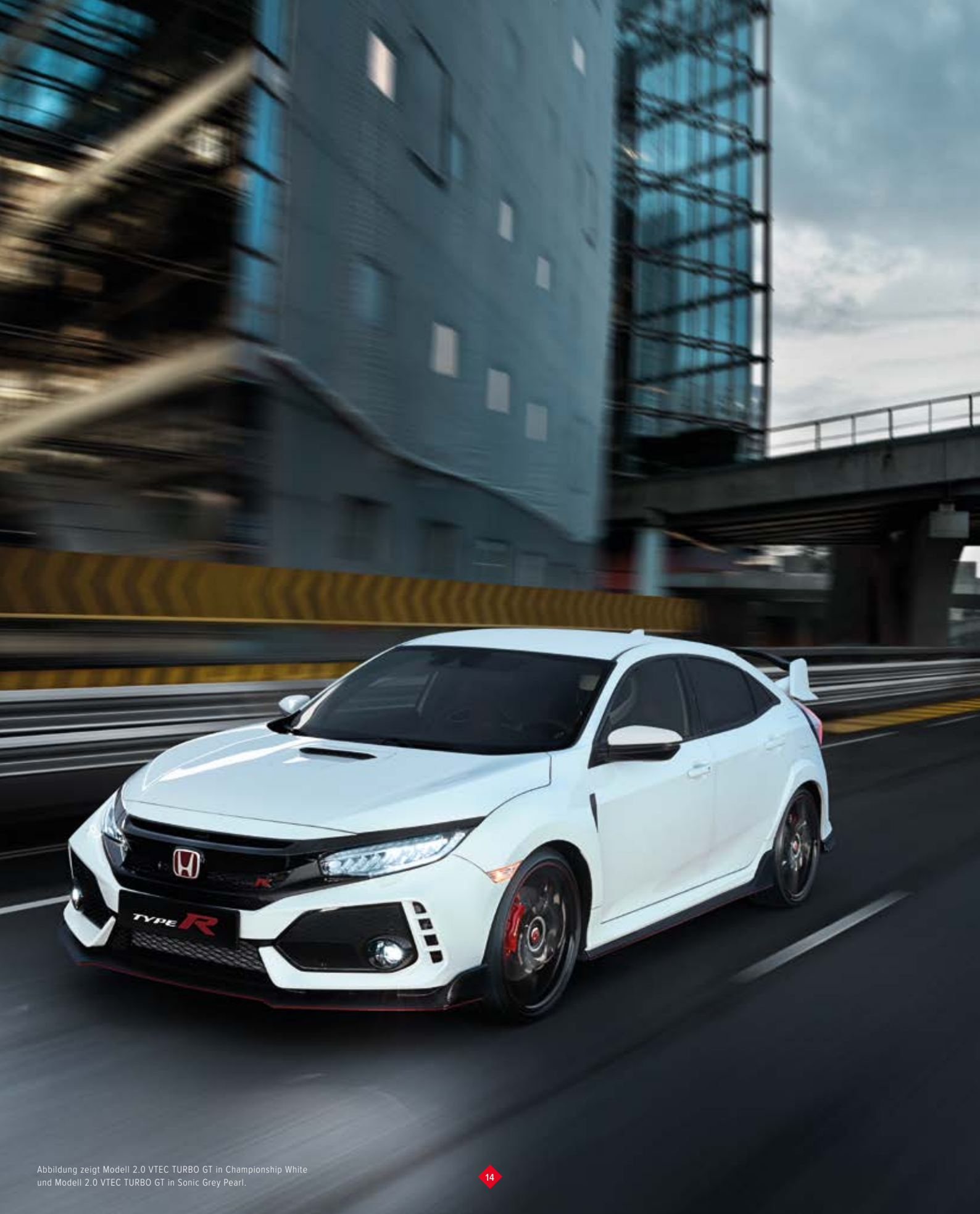
Abbildung zeigt Modell 2.0 VTEC TURBO GT in Championship White und Modell 2.0 VTEC TURBO GT in Sonic Grey Pearl.