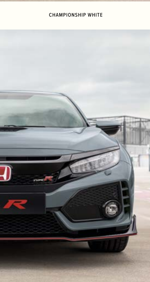
SONIC GREY PEARL