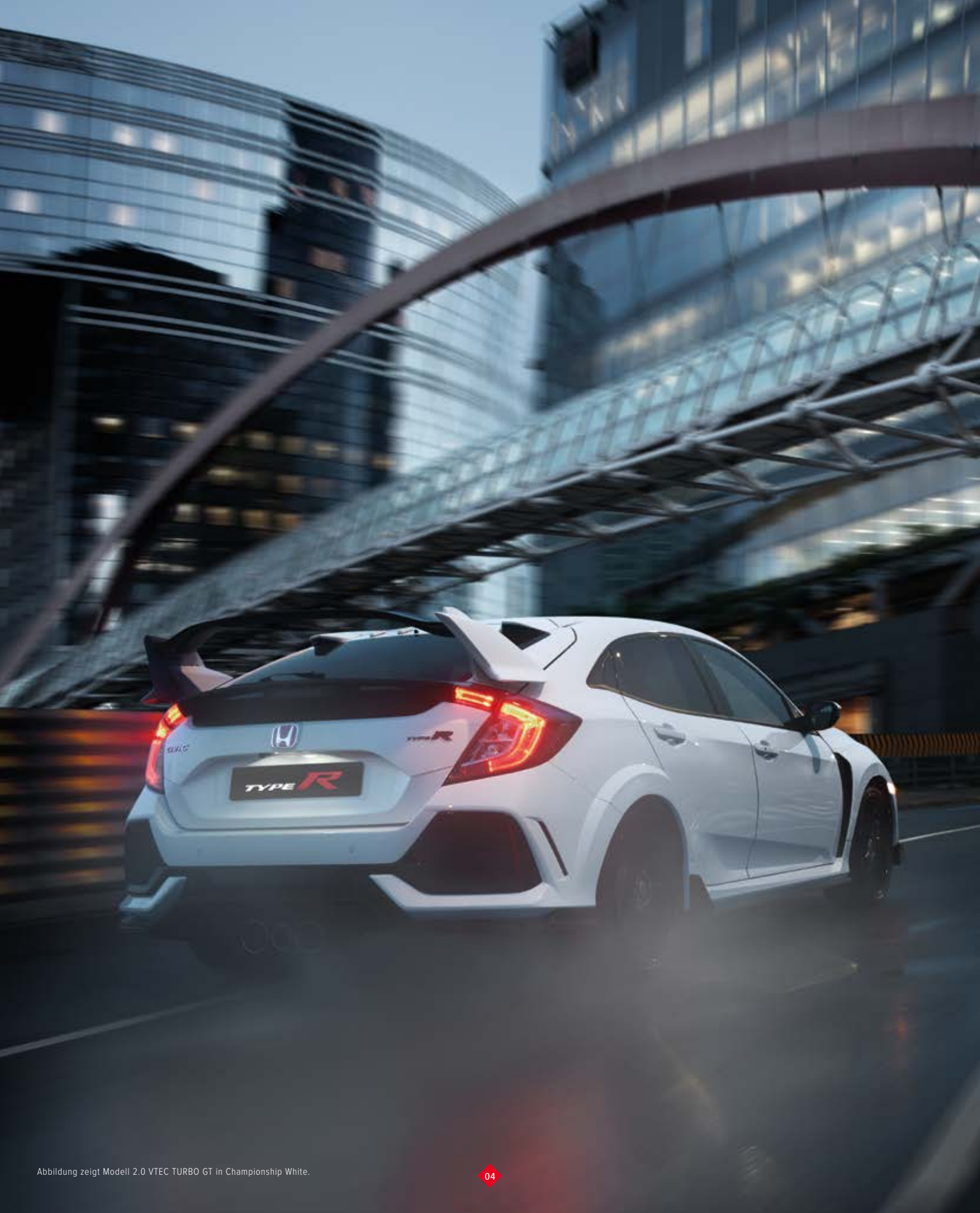
Abbildung zeigt Modell 2.0 VTEC TURBO GT in Championship White.