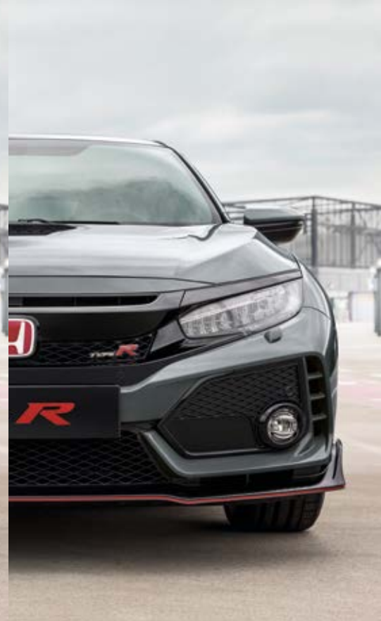
POLISHED METAL METALLIC