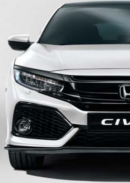
WHITE ORCHID PEARL