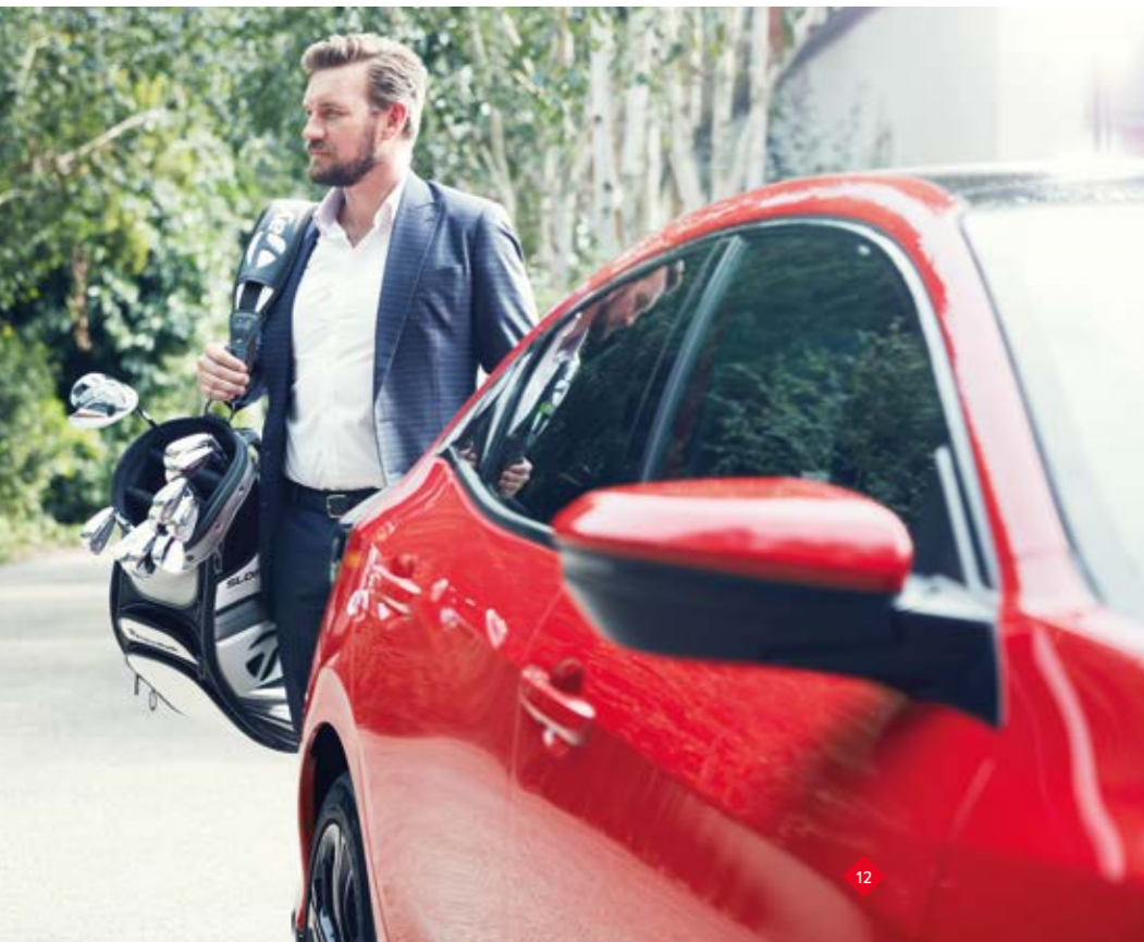
Abbildung zeigt Modell 1.5 VTEC TURBO Sport Plus in Rallye Red.

Wir wollten ein perfektes Auto für Ihren Alltag, ein Auto, das eines der geräumigsten in seiner Klasse und flexibel genug ist, um alles zu meistern, was das Leben mit sich bringt. Der Civic verfügt über viele durchdachte Details wie eine breite Heckklappenöffnung, um das Be- und Entladen zu erleichtern, eine vielseitige, im Verhältnis 60:40 teilbare Rückbank und eine intelligente Gepäckraumabdeckung, die nicht nur abnehmbar ist, sondern sowohl links als auch rechts angebracht und mit einer Hand bedient werden kann.