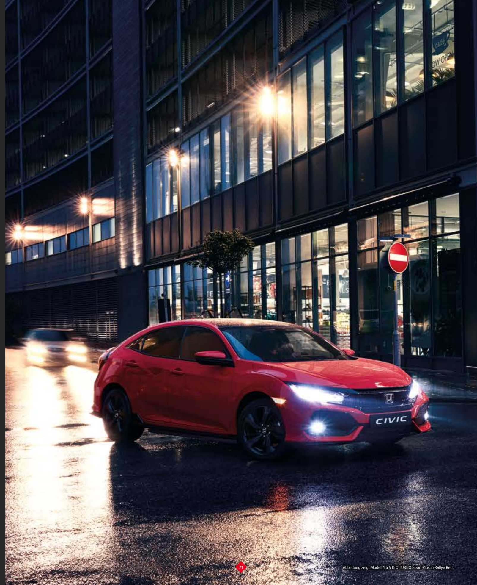
Abbildung zeigt Modell 1.5 VTEC TURBO Sport Plus in Rallye Red.