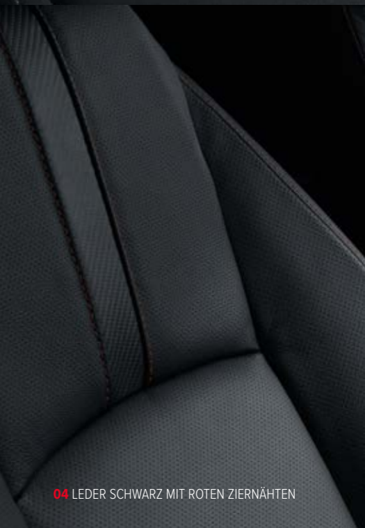
04 LEDER SCHWARZ MIT ROTEN ZIERNÄHTEN