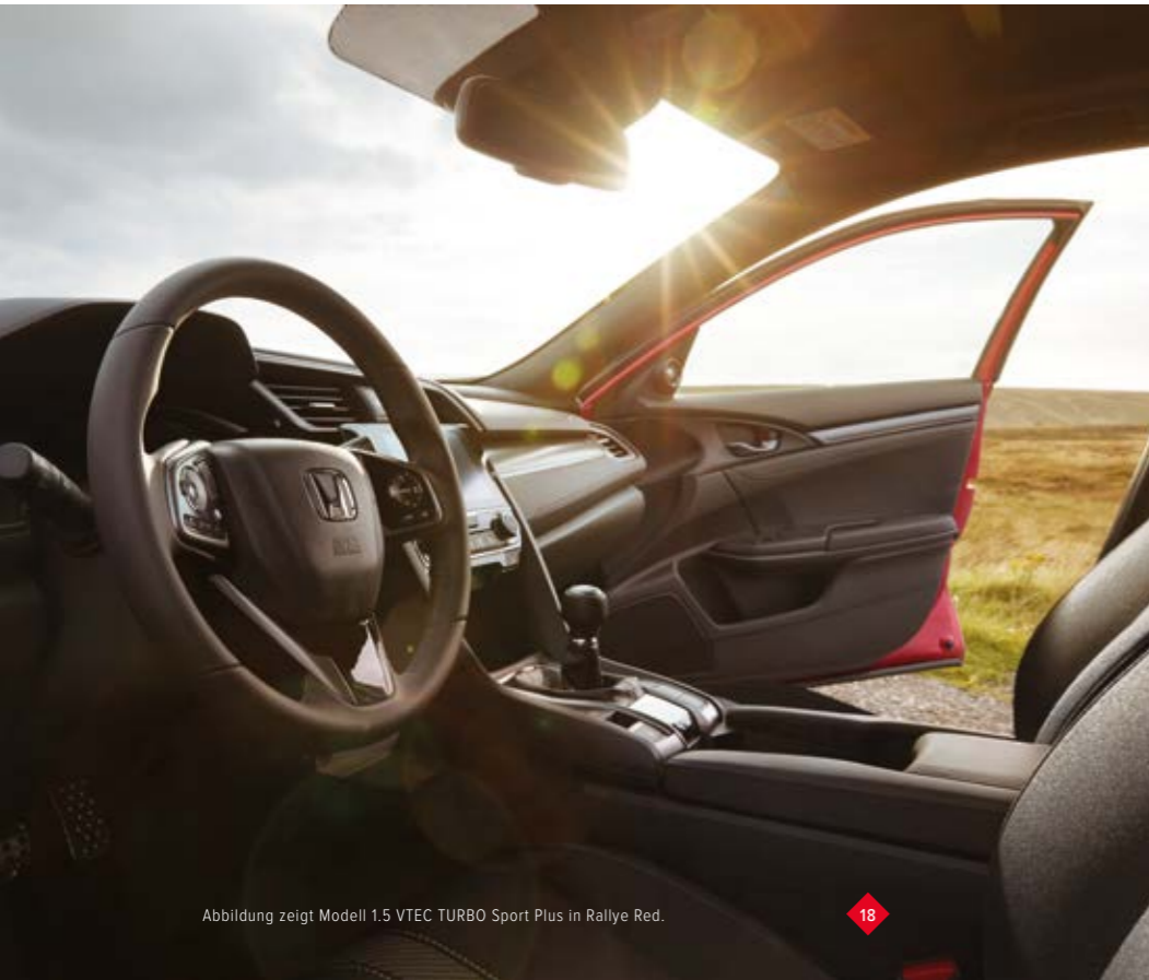
Abbildung zeigt Modell 1.5 VTEC TURBO Sport Plus in Rallye Red.

Von Ihrem Platz in den ergonomisch geformten Sitzen werden Sie rasch bemerken, dass der Civic einen der geräumigsten Innenräume seiner Klasse bietet. Genießen Sie das großzügig geschwungene Armaturenbrett, die fahrerfreundliche Anordnung der Bedienelemente und die gute Rundumsicht. Wir haben alles daran gesetzt, einen ruhigen Platz zu schaffen, an dem Sie sich einfach zurücklehnen und die Fahrt genießen können.