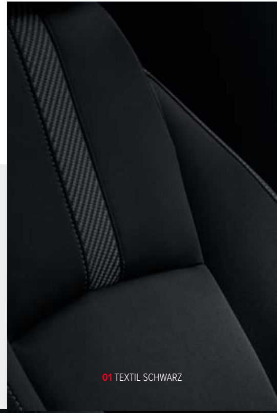
01 TEXTIL SCHWARZ