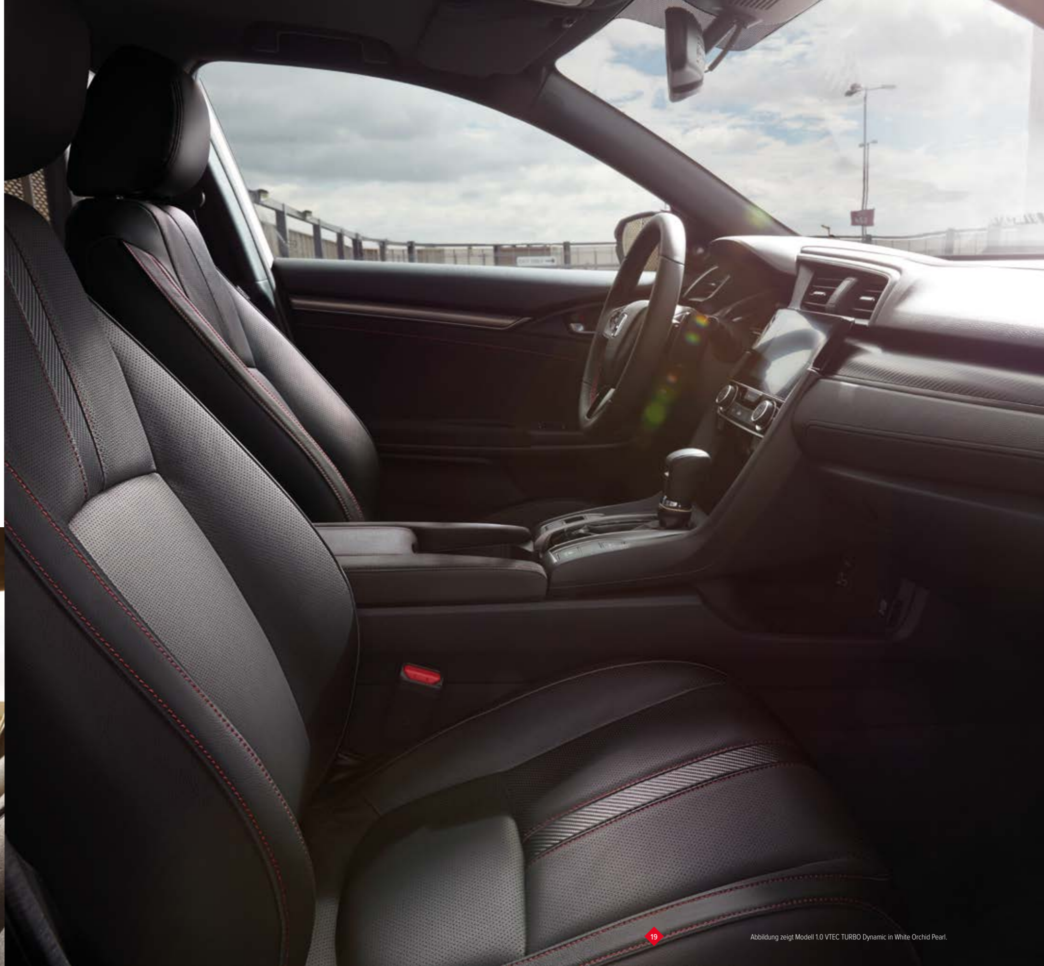
Abbildung zeigt Modell 1.0 VTEC TURBO Dynamic in White Orchid Pearl.