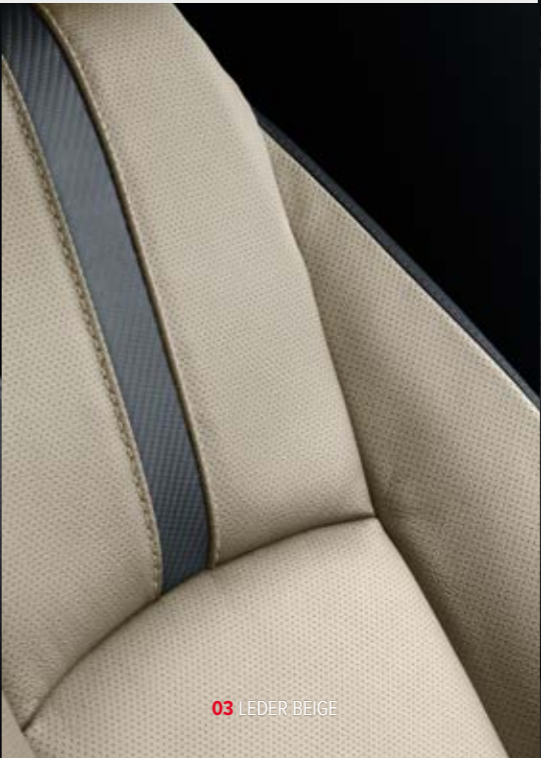
03 LEDER BEIGE