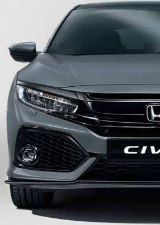
SONIC GREY PEARL