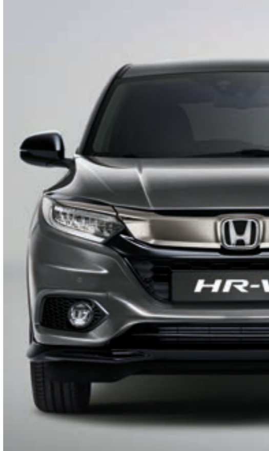
PLATINUM GREY METALLIC*