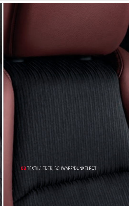
03 TEXTIL/LEDER, SCHWARZ/DUNKELROT