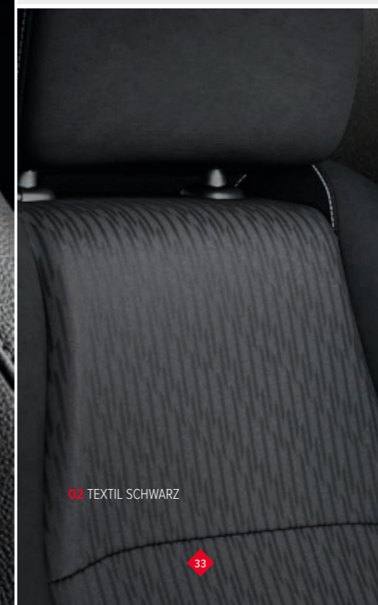
02 TEXTIL SCHWARZ