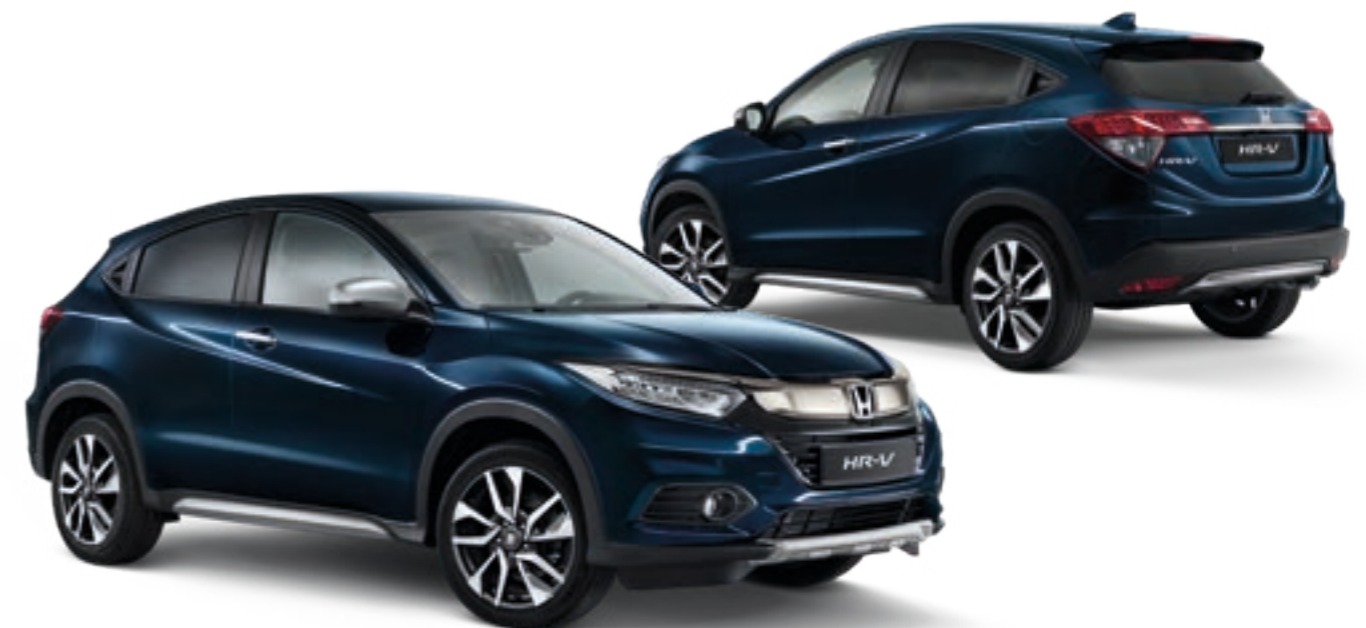
Abbildung zeigt 18-Zoll-Leichtmetallfelge HR1803

Paketinhalt: Sport-Stoßstange vorn und hinten, Trittbrettsatz, Dachspoiler.