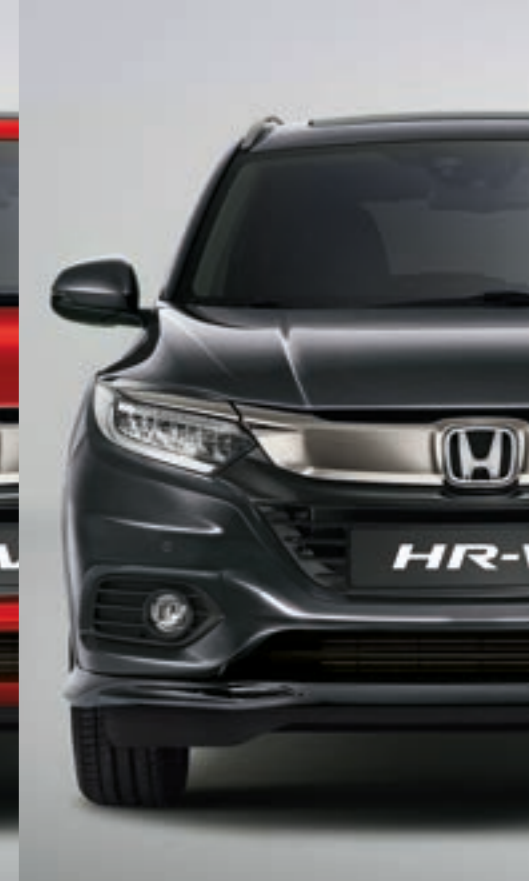
MODERN STEEL METALLIC