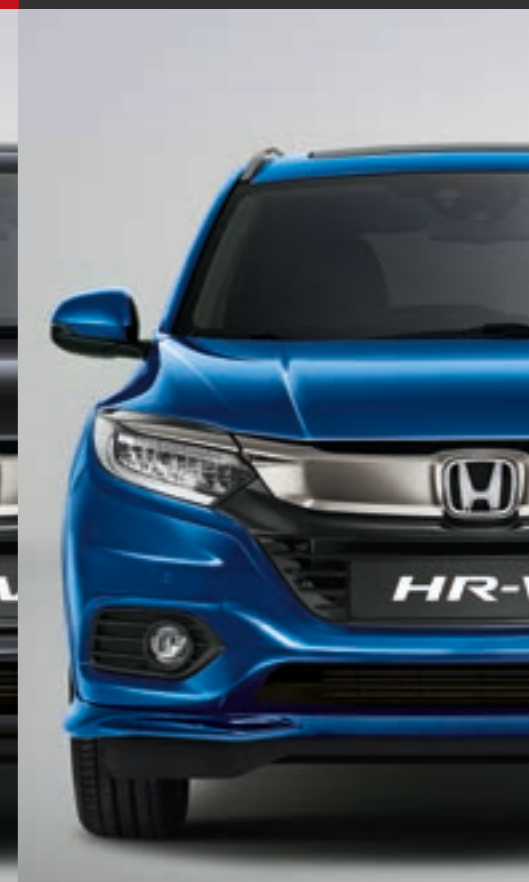
BRILLIANT SPORTY BLUE METALLIC