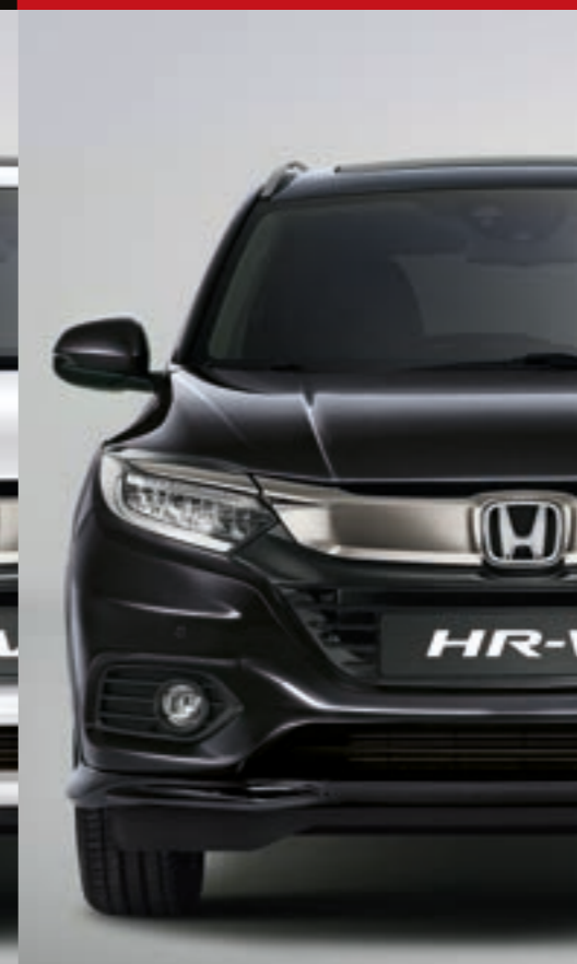
RUSE BLACK METALLIC