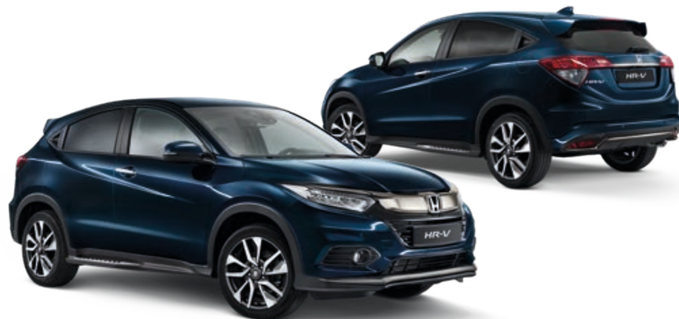
Abbildung zeigt 18-Zoll-Leichtmetallfelge HR1804

Paketinhalt: schwarzer Unterfahrschutz vorn und hinten, Trittbretter mit schwarzer Pulverbeschichtung, Black-Edition-Fußmatten und -Kofferraummatte, Black-Edition-Emblem, schwarze Spiegelkappen.