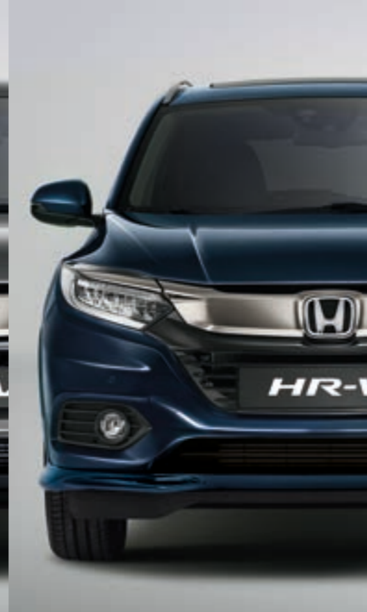
MIDNIGHT BLUE BEAM METALLIC