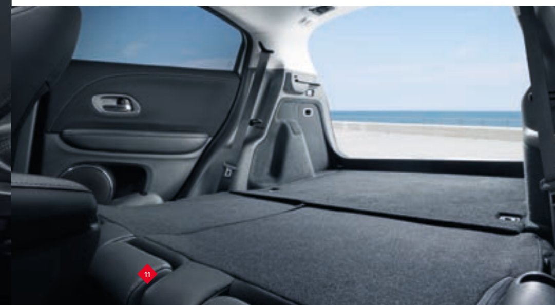
Abbildung zeigt Modell 1.5 i-VTEC Executive. Detaillierte Informationen zum Ausstattungsumfang entnehmen Sie bitte der Tabelle ab Seite 42.

Aber nicht nur die Sitze sind magisch. Die Tatsache, dass der HR-V die gleiche komfortable Bein- und Kopffreiheit bietet, die man von größeren Autos gewohnt ist, kommt ebenfalls einem Zaubertrick gleich. Das großzügige Raumgefühl wird zusätzlich durch ein Panorama-Glasschiebedach betont, das geöffnet werden kann, um Licht und frische Luft hineinzulassen.