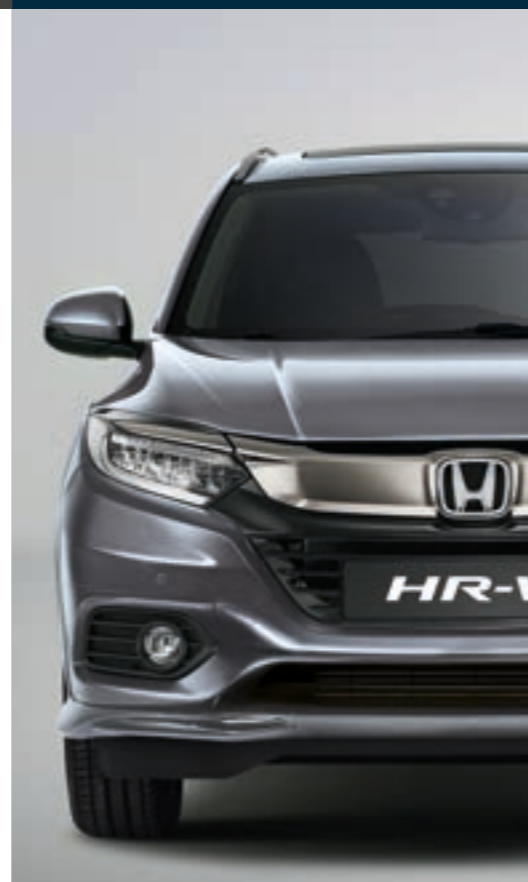
LUNAR SILVER METALLIC

Zeigen Sie Persönlichkeit und wählen Sie aus einer Palette von Farben, welche den dynamischen Auftritt des HR-V perfekt ergänzen. Neu im Programm sind die aufregenden Farbtöne Midnight Blue Beam Metallic, Platinum White Pearl und Platinum Grey Metallic.