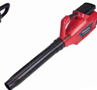
10 LAUBBLÄSER ♦