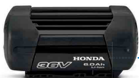
36V 6,0 Ah DP3660XA