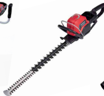
10 HECKENSCHERE ♦