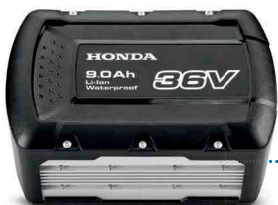
36V 9,0 Ah DPW3690XA