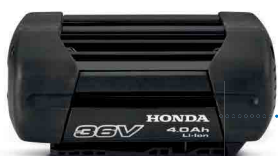
36V 4,0 Ah DP3640XA