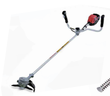
09 MOTORSSENSEN ♦