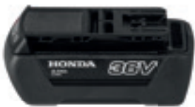
36V 2,0 Ah DP3620XA E

Eine Auswahl an universellen Honda Li-Ion-Akkus für die Akku-Reihe.