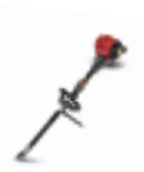
UMC 425 E