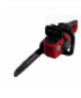
HHC 36 BXB