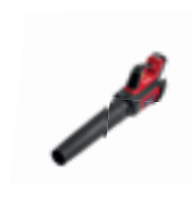
HHB 36 BXB