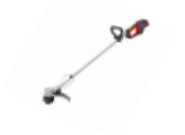
HHT 36 BXB