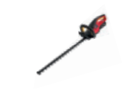
HHH 36 BXB