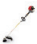
UMK 450 LE