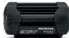
36V 6,0 Ah DP3660XA