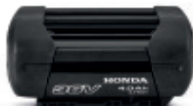
36V 4,0 Ah DP3640XA