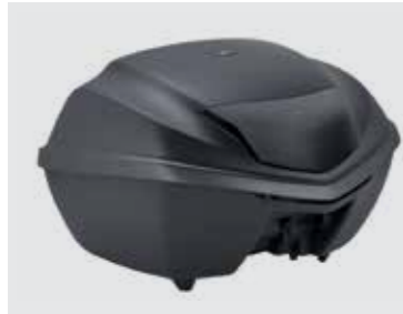
TOPCASE 35 LITER 08L72-MJE-D00ZA

35-Liter Topcase wird mit dem Fahrzeugschlüssel gesperrt. Zusätzlich erforderlich • 1x anlenkbares Zylinderschloss (08M70-MJE-D01) • 1x Zylinderhalter (08M71-MJE-D01) • 1x Gepäckträger (08L70-MKA-D80)