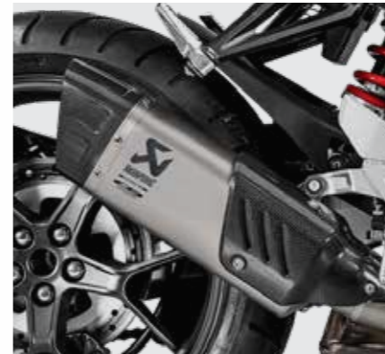
AKRAPOVIC SLIP-ON SCHALLDÄMPER

08F88-MKJ-900 Dieser formschöne Schalldämpfer aus Titan ist mit einer handgefertigten Carbon-Endkappe und Hitzeschild versehen. Mit dem einzigartigen Akrapović Sound, reduziert dieser Auspuff das Gewicht um über 54 % gegenüber dem Standard und sorgt so für besseres Handling und Wendigkeit. Er lässt sich einfach installieren und ist EC- und ECE-konform. Verbesserungen: • Leistung: + 1,6 PS bei 10.000 min -1 • Drehmoment: + 1,2 Nm bei 10.000 min -1 • Gewicht: - 2,2 kg