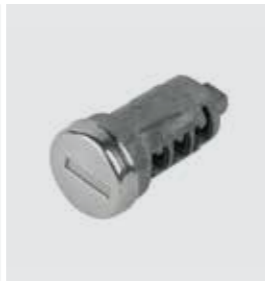
ANLENKBARES ZYLINDERSCHLOSS 08M70-MJE-D03

2 graue Nylon-Innentaschen mit jeweils 16 Liter Volumen. Schwarzes Honda Logo vorne gestickt. Inklusive verstellbarem Schultergurt und Halteriemern.