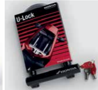
U-SCHLOSS 08M53-MFL-800 Manipulationssicheres Absperrschloss.