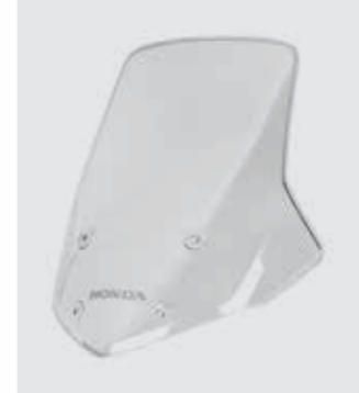
HOHER WINDSCHILD 08R72-MGS-D10

Stylischer Windschild bietet verbesserten Fahrkomfort bei hohen Geschwindigkeiten 50 mm höher und 40 mm breiter als die Standardscheibe.