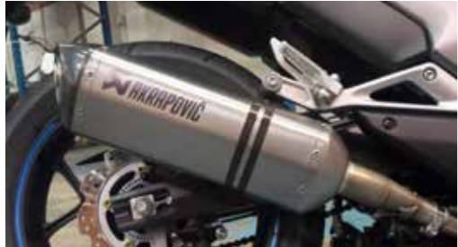
AKRAPOVIC SLIP-ON SCHALLDÄMPER 08F88-MKA-900