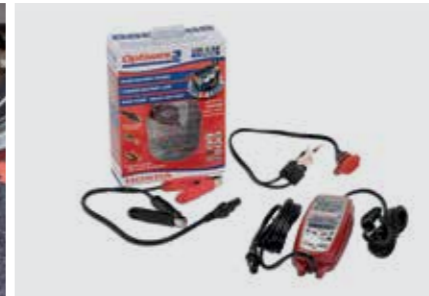
HONDA OPTIMATE 3 08M51-EWA-601E

Für sicheres Parken auf unterschiedlichsten Bodenoberflächen. Erleichtert Reinigung des Motorrads sowie Wartung am Hinterrad.