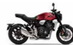
Candy Chromosphere Red

(Auch erhältlich in der CB1000R+ Version)