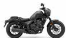
S Edition in Matt Axis Grey Metallic