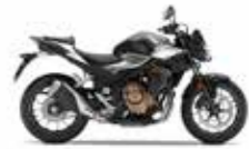
Gunpowder Black Metallic