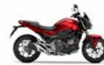
Candy Chromosphere Red