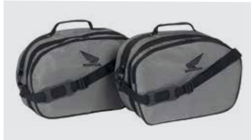
INNENTASCHE FÜR SEITENKOFFERSET 29 LITER 08L79-MGS-J30

Schwarze Nylon-Innentasche mit silberfarbigem Honda Logo. Von 15 auf 25 Liter erweiterbar. Vorderes Fach für A4-Unterlagen geeignet. Inklusive verstellbarem Schultergurt und Halteriemern.