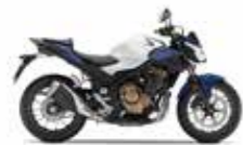
Pearl Metalloid White