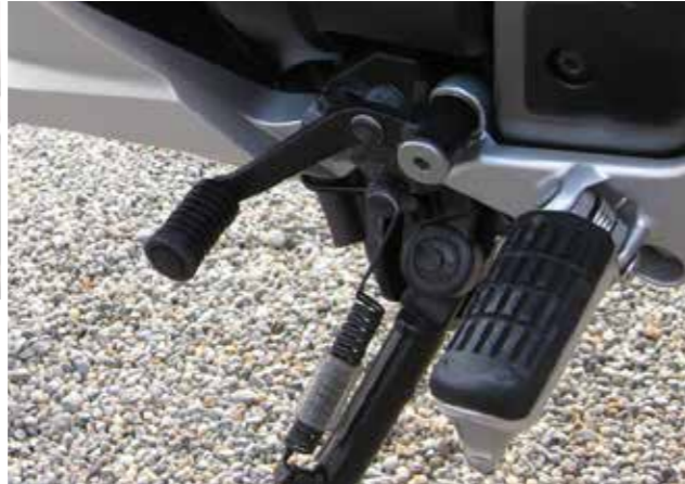
DCT-SCHALTPEDAL KIT 08U70-MGS-D51

Ermöglicht es bei mit DCT ausgestatteten Motorrädern, traditionell mit dem linken Fuß zu schalten.