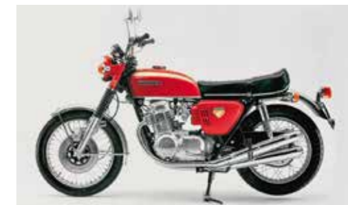
Die Dream CB750 FOUR, die im Juli 1969 auf den Markt kam

Nach fünf aufeinanderfolgenden Titeln in der Motorrad-Weltmeisterschaft zog sich Honda zurück und widmete sich seinem Hauptziel: das im Wettkampf erworbene Wissen und die dort verwendete Technologie für die Entwicklung von Hochleistungsmaschinen für Konsumenten umzusetzen. Nach einem ersten Versuch mit einem 450 cm 3 Modell brachte Honda im Jänner 1969 die CB750 Four auf den Markt. Die ursprüngliche Produktionsprognose von 1.500 Stück pro Jahr wurde bald zu einer monatlichen Stückzahl, die rasant auf 3.000 Stück pro Monat stieg. Honda erweiterte die Grenzen von Leistung, Zuverlässigkeit und einfachem Handling bei Motorrädern und schuf so eine neue Superbike-Klasse. Die CB1000R ist der moderne Ausdruck der Leidenschaft, der die Ingenieure von Honda seit Jahrzehnten leitet.