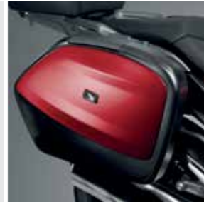
SEITENKOFFER 29 LITER 08ESY-MKD-PA17

35-Liter Topcase wird mit dem Fahrzeugschlüssel gesperrt. Zusätzlich erforderlich • 1x anlenkbares Zylinderschloss (08M70-MJE-D01) • 1x Zylinderhalter (08M71-MJE-D01) • 1x Gepäckträger (08L70-MKA-D80)