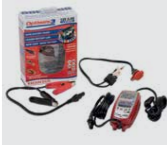
HONDA OPTIMATE 3 08M51-EWA-601E 12-V-Batteriepflege zu Hause. Empfohlen für AGM/MF-, Standard-, Gel- und Spiralzellenbatterien von 2,5 Ah bis 50 Ah Nennkapazität