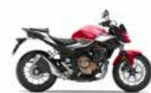
Grand Prix Red