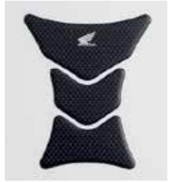
TANK PAD 08P61-KAZ-800A

Tank Pad im Carbon-Design mit Honda Wing Logo.