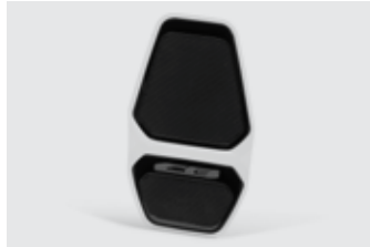
TANK PAD 08P71-MKN-D50

Hilft, die Tanklackierung vor Kratzern zu schützen.