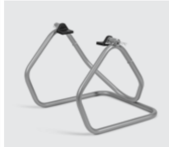
WARTUNGSSTÄNDER HINTEN 08M50-MW0-801 Neigbarer Stahlrohrständer, erleichtert Reinigung und Wartung des Hinterrads.