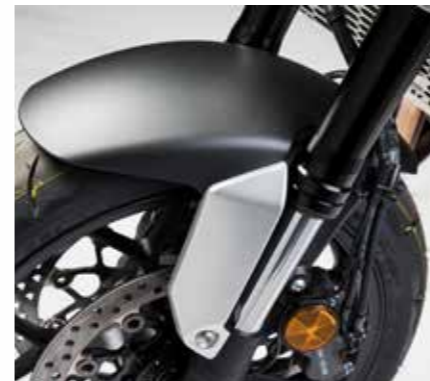
VERKLEIDUNG VORDERER KOTFLÜGEL*

08F80-MKJ-D00ZA, D00ZC, D90ZA Sitzabdeckung passend zur Farbe des Motorrads, ausgestattet mit einem hochwertigen Aluminiumdekor. Wird anstelle des Sozius montiert. In 3 Farben erhältlich: • Candy Chromosphere Red (D00ZA) • Graphite Black (D00ZC) • Matt Pearl Glare White (D90ZA)