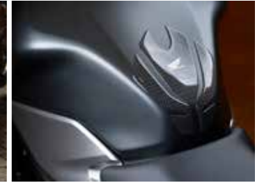
TANK PAD 08P61-KYJ-800

Einfach anzubringen, können diese Streifen auf beiden Seiten der Felgen aufgeklebt werden und verleihen dem Bike ein sportlicheres Auftreten. In 3 Farben erhältlich: - Pearl Metalloid White mit silberfarbenen Akzenten (J40ZG) - Pearl Metalloid White mit orangenen Akzenten (J40ZJ) - Matt Crypton Silver Metallic (J40ZH)