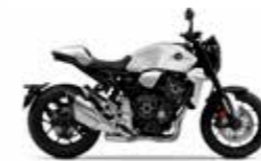
Matt Pearl Glare White

(Auch erhältlich in der CB1000R+ Version)