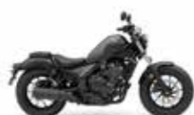
Matt Axis Grey Metallic