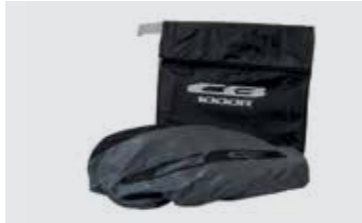
FALTGARAGE FÜR INNEN 08P70-MKJ-D00

Selbstklebender Nylon-Schutzring für das linke Kurbelgehäuse, einfach zu installieren.