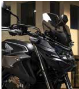
WINDSCHILD (GETÖNT) 8R70-MKP-D40

Der getönte Windschild erhöht den Gesamtkomfort des Motorrads, schützt den Fahrer bei Wind und Wetter und verleiht der Optik des Bikes zusätzlich Ausdruck.