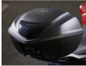
TOPCASE 35 LITER 08ESY-MKP-TB19

Eine einfache und funktionale, an die Tankform angepasste Tanktasche. Dank inkludiertem Anbausatz beeinträchtigt die stabile Montage der Tanktasche das Handling der Maschine nicht. Ein durchsichtiges Fach an der Oberseite sorgt für einfache Aufbewahrung eines Smartphones. Das Volumen der Tasche beträgt 3 Liter. Regenschutz inkludiert. Abmessungen in mm (B x L x H): 178 x 285 x 130