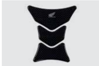
TANK PAD 08P61-KAZ-800A

Hilft, die Tanklackierung vor Kratzern zu schützen.