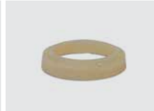
KURBELGEHÄUSE ABDECKUNG 08F75-MKJ-D00

3-teiliges Tank Pad im Carbon-Design, mit Honda Wing Logo.