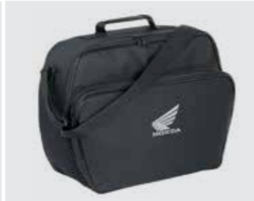
INNENENTASCHE FÜR TOPCASE 35 LITER 08L09-MGS-D30

Speziell für die Montage des 35-Liter-Topcase und der 29-Liter-Seitenkoffer an der NC750S.