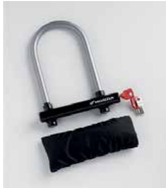
U-SCHLOSS 123-217 08M53-MEE-800

Manipulationssicheres U-Schloss, das unter den Sitz der NC750S passt.