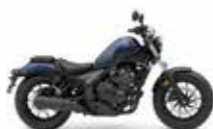
Matt Jeans Blue Metallic

Abbildungen zeigen teilweise das US-Modell. Europäische Modelle sind mit schwarzem Sitz und serienmäßigem Soziussitz ausgestattet, die seitlichen Kennzeichenreflektoren entfallen.