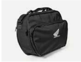
INNENTASCHE TOPCASE 08L09-MGS-D30

Das Set beinhaltet ein 35-Liter-Topcase und alle zur Montage notwendigen Komponenten (Gepäckträger und Anbauplatte). Wird mit dem Fahrzeugschlüssel gesperrt. Inklusive Innentasche (08L09-MGS-D30).