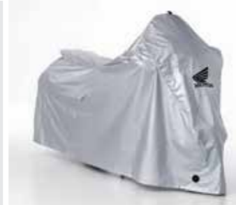
OUTDOOR FALTGARAGE 08P34-BC2-801 Schützt den Lack vor UV-Strahlung, Wasserdichtes, atmungsaktives Gewebe, das das Motorrad trocknen lässt, während es abgedeckt ist. Seil zum Festziehen der Abdeckung, um Flattern zu vermeiden. Zwei Öffnungen im vorderen unteren Bereich zur einfachen Verwendung des U-Schlusses.