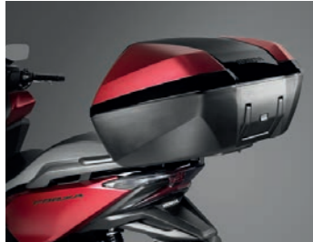
TOPCASE-SET 45 LITER 08ESY-K40-TB19ZA

Set, das alle erforderlichen Komponenten zur Installation des farblich abgestimmten 45 Liter Topcases mit SMART Key-Bedienung am Fahrzeug beinhaltet: schwarzer Topcase-Träger, farblich passende Abdeckung (siehe unten), Rückenlehne, Deckelöffner und Gepäckträger.