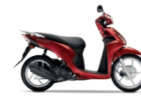
Pearl Splendor Red