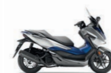
Matt Lucent Silver Metallic