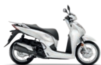
Pearl Cool White