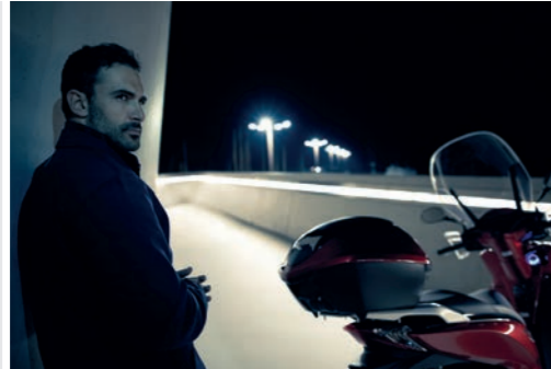
INNENTASCHE TOPCASE 35 LITER 08L09-MGS-D30

Schwarze Nylon tasche mit silberfarbenem Honda Logo auf der Vordertasche. Von 15 auf 25 Liter erweiterbar. Die Vordertasche bietet Platz für eine A4-Mappe. Wird mit verstellbarem Schultergurt und Tragegriffen geliefert.