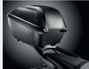
TOPCASE 35 LITER 08L72-MJE-D00ZA

Hellgraue Nylontasche mit schwarzen Reißverschlüssen und gesticktem, schwarzem Honda Logo auf der Vordertasche. Von 21 auf 33 Liter erweiterbar. Die Vordertasche bietet Platz für eine A4-Mappe. Wird mit verstellbarem Schultergurt und Tragegriff geliefert.