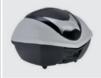
TOPCASE-SET 35 LITER 08ESY-K40-F30ZD

Komfortable Rückenlehne, die auf dem 45L Topcase installiert werden kann (separat erhältlich)