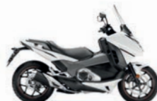
Pearl Glare White