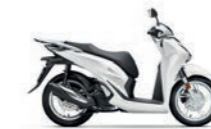
Pearl Cool White

*gleiche Farboptionen für 125cc und 150cc