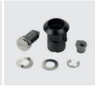
ANLEARNBARES ZYLINDERSCHLOSS 08M71-KZL-840

Wird für die Montage des Topcase benötigt.