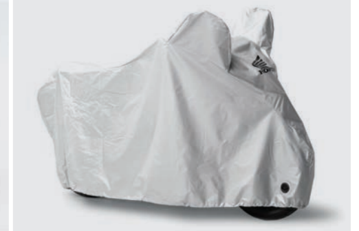
OUTDOOR FALTGARAGE 08P34-BC3-801

Manipulationssicheres Absperrschloss, das unter den Sitz passt.