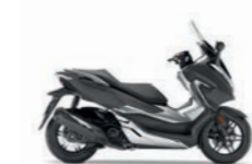
Matt Cynos Grey Metallic