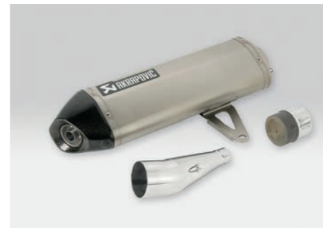
AKRAPOVIC SLIP-ON SCHALLDÄMPFER 08F88-MKA-900

Schalldämpfer aus Titan mit Carbon Endkappe. Inklusive Montageset. Kompatibel mit Seitenkoffern und Hauptständer. ECE-zugelassen