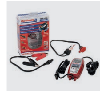
HONDA OPTIMATE 3 08M51-EWA-601E

12-V-Batteriepflege zu Hause. Empfohlen für AGM/MF-, Standard-, Gel- und Spiralzellenbatterien von 2,5Ah bis 50Ah Nennkapazität