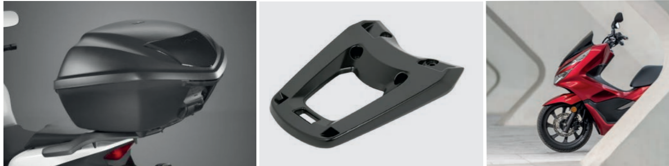
TOPCASE-SET 35 LITER 08ESY-K96-TB18

35 Liter Fassungsvermögen. Dieses Topcase bietet Platz für 1 Integralhelm und mehr. Der Deckel ist in Matt Cynos Grey lackiert. Schnell zu verriegeln und leicht abzunehmen. Dieses Set besteht aus dem 35 Liter Topcase, dem Träger und einem Zylinderschloss.