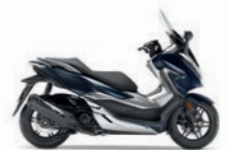
Crescent Blue Metallic