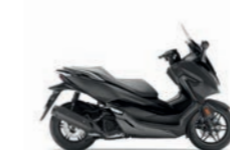
Matt Cynos Grey Metallic