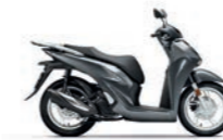
Timeless Grey Metallic