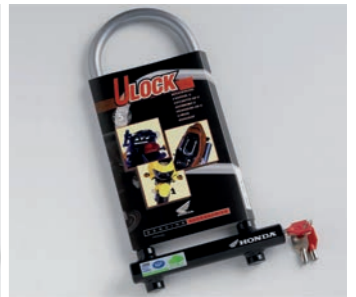
U-SCHLOSS 123-217 08M53-MEE-800

Schützt den Lack vor UV-Strahlung. Wasserdichtes, atmungsaktives Gewebe, das das Motorrad trocknen lässt, während es abgedeckt ist. Seil zum Festziehen der Abdeckung, um Flattern zu vermeiden. Zwei Öffnungen im vorderen unteren Bereich zur einfachen Verwendung des U-Schlusses. In zwei Größen verfügbar: Standard (08P34-BC3-801) – XL (08P34-MCH-000); kann verwendet werden, wenn das Topcase montiert ist.