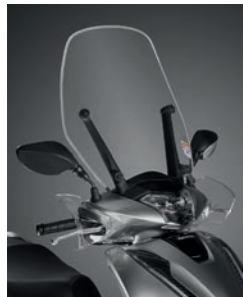
HOHER WINDSCHILD 08R70-K53-D00

Set bestehend aus Polycarbonat-Windschild und Handprotektoren. Höhe Windschild: 46 cm