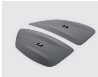
FARBEINSATZ SEITENKOFFER-SET 08F70-MJF-A00A7 - PEARL GLARE WHITE 08F70-MJF-A00B3 - MATT ALPHA SILVER METALLIC 08F70-MJF-A00B5 - CANDY CHROMOSPHERE RED 08F70-MJF-A00ZJ - MATT GUNPOWDER BLACK METALLIC

Set bestehend aus Paneelen zur Verkleidung der Seitenkoffer, farblich passend.