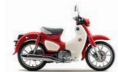
Pearl Nebula Red