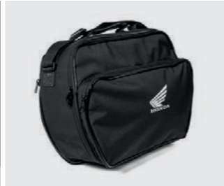
INNENTASCHE TOPCASE 35 LITER 08L09-MGS-D30

Topcase mit 35 Liter Fassungsvermögen. Bedienung mit dem Roller-Schlüssel. Muss mit folgenden Komponenten kombiniert werden (separat erhältlich): - Schließzylinder-Set (08M70-MJE-D01) - Zylinderhalter (08M71-MJE-D01) - Gepäckträger (08L70-MKA-D80)