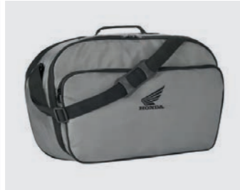
INNENTASCHE TOPCASE 45 LITER 08L81-MCW-H60

45 Liter Topcase, mit einem Fassungsvermögen für 2 Integralhelme und mehr. Es stehen 3 Farben für den Topcase-Deckel zur Verfügung, passend zu deinem Integra. Das Komplettpaket beinhaltet ein anlenkbare Zylinderschloss, das die Benutzung mit dem Schlüssel des Motorrads ermöglicht. Rückenlehne und Gepäckträger sind inbegriffen.