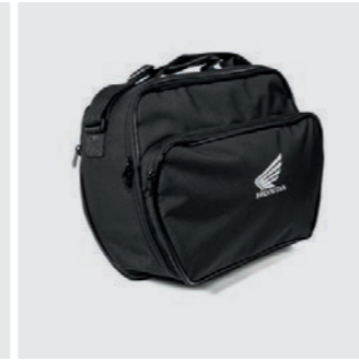
INNENTASCHE FÜR 35 LITER TOPCASE 08L09-MGS-D30

Ermöglicht das Versperren des Topcase mit dem Fahrzeugschlüssel