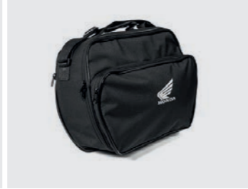
INNENTASCHE TOPCASE 35 LITER 08L09-MGS-D30

Für FORZA 125 sind 3 Farben erhältlich: - Matt Cynos Grey Metallic (F30ZA) - Black (F30ZB) - Matt Pearl Cool White (F30ZD)