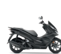
Matt Carbonium Grey Metallic