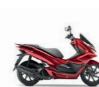
Pearl Splendor Red