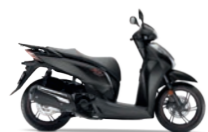
Matt Cynos Grey Metallic