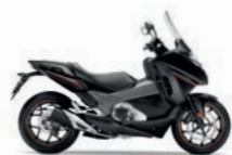
Matt Ballistic Black Metallic