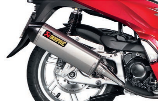
AKRAPOVIC SLIP-ON 08F88-K53-900

Schalldämpfer aus Titan mit Carbon Endkappe. Inkl. Montageset. EC/ECE-zugelassen