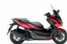
Matt Carnelian Red Metallic