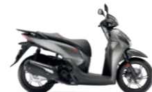
Matt Ruthenium Silver Metallic