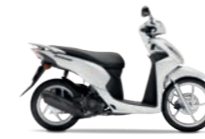
Pearl Cool White