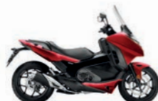
Candy Chromosphere Red