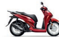
Pearl Splendor Red

Manipulationssicheres Absperrschloss, das unter den Sitz passt.