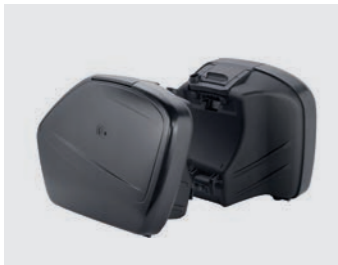
SEITENKOFFER-SET 29 LITER MIT HALTERUNG 08ESY-MKD-PA17

Schwarze Nylon tasche mit silberfarbenem Honda Logo auf der Vordertasche. Von 15 auf 25 Liter erweiterbar. Die Vordertasche bietet Platz für eine A4-Mappe. Wird mit verstellbarem Schultergurt und Tragegriffen geliefert.