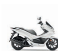
Pearl Cool White