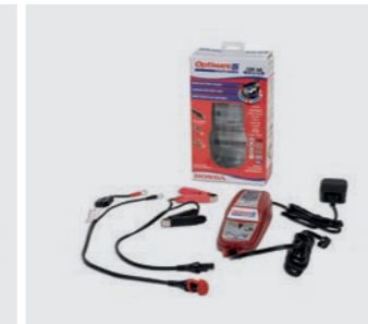
HONDA OPTIMATE 5 08M51-EWA-801E

12-V-Batteriepflege zu Hause. Empfohlen für AGM/MF-, Standard-, Gel- und Spiralzellenbatterien von 2,5Ah bis 50Ah Nennkapazität