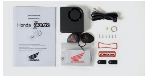
AVERTO ALARMANLAGE 08E70-MGH-640

Eine kompakte Alarmvorrichtung mit einer 118 dB-Sirene und einem Bewegungs- und Schockmelder, mit 8 Empfindlichkeitseinstellungen. Eine Reservebatterie und ein verbrauchsarmer Schlafmodus sorgen dafür, dass die Batterie vor Entladung geschützt ist. Muss kombiniert werden mit: - Anbausatz (08E70-MKH-D20)* - Magnetschalter (08E70-MCS-G40)* *separat erhältlich