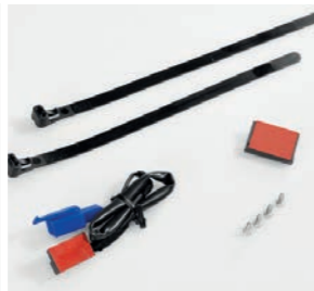
ANBAUSATZ ALARMANLAGE 08E70-MKH-D20

Eine kompakte Alarmvorrichtung mit einer 118 dB-Sirene und einem Bewegungs- und Schockmelder, mit 8 Empfindlichkeitseinstellungen. Eine Reservebatterie und ein verbrauchsarmer Schlafmodus sorgen dafür, dass die Batterie vor Entladung geschützt ist. Muss kombiniert werden mit: - Anbausatz (08E70-MKH-D20)* - Magnetschalter (08E70-MCS-G40)* *separat erhältlich