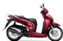
Pearl Splendor Red