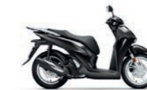
Pearl Nightstar Black