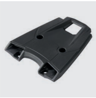
TOPCASE TRÄGER 08L71-MGZ-J01

Topcase mit 35 Liter Fassungsvermögen, das einen Integralhelm und mehr aufnehmen kann. Deckel in mattem Cynos-Grau lackiert. Schnell zu verschließen und leicht abnehmbar. Anlernbares Zylinderschloß und Träger separat erhältlich.