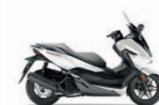
Matt Pearl Cool White