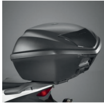
TOPCASE 35 LITER 08L71-KZL-861ZA

Topcase mit 35 Liter Fassungsvermögen, das einen Integralhelm und mehr aufnehmen kann. Deckel in mattem Cynos-Grau lackiert. Schnell zu verschließen und leicht abnehmbar. Anlernbares Zylinderschloß und Träger separat erhältlich.