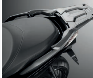
GEPÄCKTRÄGER FÜR 35 LITER TOPCASE 08L70-K40-F00

Schwarze Nylon Tasche mit silberfarbenem Honda Logo auf der Vordertasche. Von 15 auf 25 Liter erweiterbar. Die Vordertasche bietet Platz für eine A4-Mappe. Wird mit verstellbarem Schultergurt und Tragegriffen geliefert.