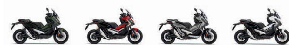
Matt Armored Green Metallic