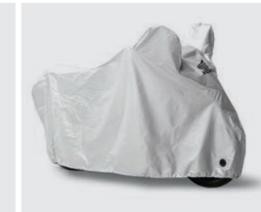
OUTDOOR FALTGARAGE 08P34-BC3-801/08P34-MCH-000

12-V-Batteriepflege zu Hause. Empfohlen für AGM/MF-, Standard-, Gel- und Spiralzellenbatterien von 15Ah bis 192Ah Nennkapazität