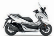
Matt Pearl Cool White