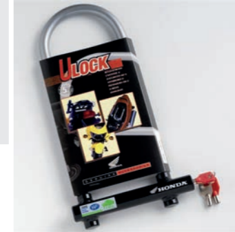
U-SCHLOSS 120-340 08M53-KAZ-800

Extrem schmale, beheizte Griffe mit integrierter Schaltung für maximalen Komfort und Designintegration. Intelligente Wärmeverteilung, die sich auf den kälteempfindlichsten Bereich der Hände konzentriert. 5 variable Heizstufen zur Auswahl mit integriertem Schaltkreis zum Schutz der Batterie vor Entladung. Dieses Set beinhaltet alle benötigten Komponenten, um die Heizgriffe zu montieren. (Heizgriffe, Anbausatz, hitzebeständiger Heizgriffkleber)