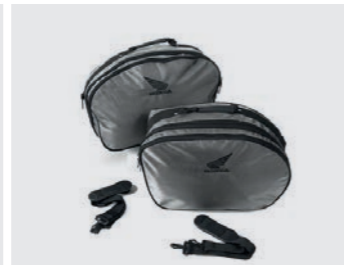
INNENTASCHEN-SET FÜR SEITENKOFFER 08L79-MGS-J30

Set bestehend aus Paneelen zur Verkleidung der Seitenkoffer, farblich passend.