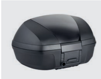
TOPCASE 45 LITER 08ESY-MKL-TB192R / MATT BALLISTIC BLACK METALLIC 08ESY-MKL-TB192G / PEARL GLARE WHITE 08ESY-MKL-TB192T / CANDY CHROMOSPHERE RED

45 Liter Topcase, mit einem Fassungsvermögen für 2 Integralhelme und mehr. Es stehen 3 Farben für den Topcase-Deckel zur Verfügung, passend zu deinem Integra. Das Komplettpaket beinhaltet ein anlenkbare Zylinderschloss, das die Benutzung mit dem Schlüssel des Motorrads ermöglicht. Rückenlehne und Gepäckträger sind inbegriffen.