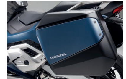
FARBEINSATZ FÜR SEITENKOFFER 08L81-MKT-D00ZE, F, G oder H

Perfekt auf die Abdeckung abgestimmt, verleiht dieser Parkhebel aus Aluminium dem Cockpit deines Forza 750 eine unverwechselbare Note.