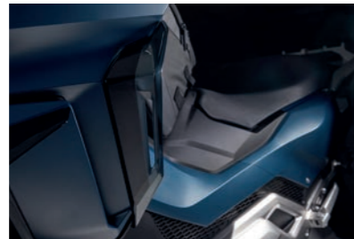
WINDABWEISER OBEN 08R72-MKV-D00

Die 5 Temperaturstufen dieser schlanken Heizgriffe werden auf dem TFT-Monitor angezeigt. Beim Ausschalten der Zündung wird die letzte Position gespeichert. Eine integrierte Schaltung schützt die Batterie vor dem Entladen.