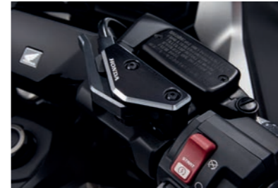
ABDECKUNG FÜR FESTSTELLBREMSHEBEL 08F72-MKT-D00

Mit dem schwarz eloxierten Design und Honda Logo macht diese Abdeckung dein Motorrad zu einem echten Hingucker.