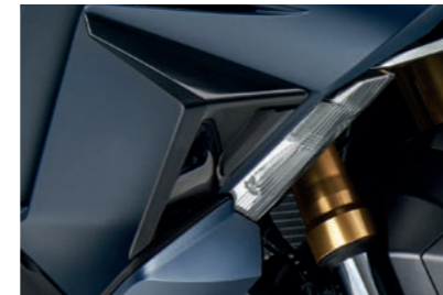
WINDABWEISER UNTEN 08R71-MKV-D00

Die mit dem Forza Logo versehenen oberen Windabweiser erhöhen den Komfort durch Reduktion des Luftstroms im Bereich der Taille.